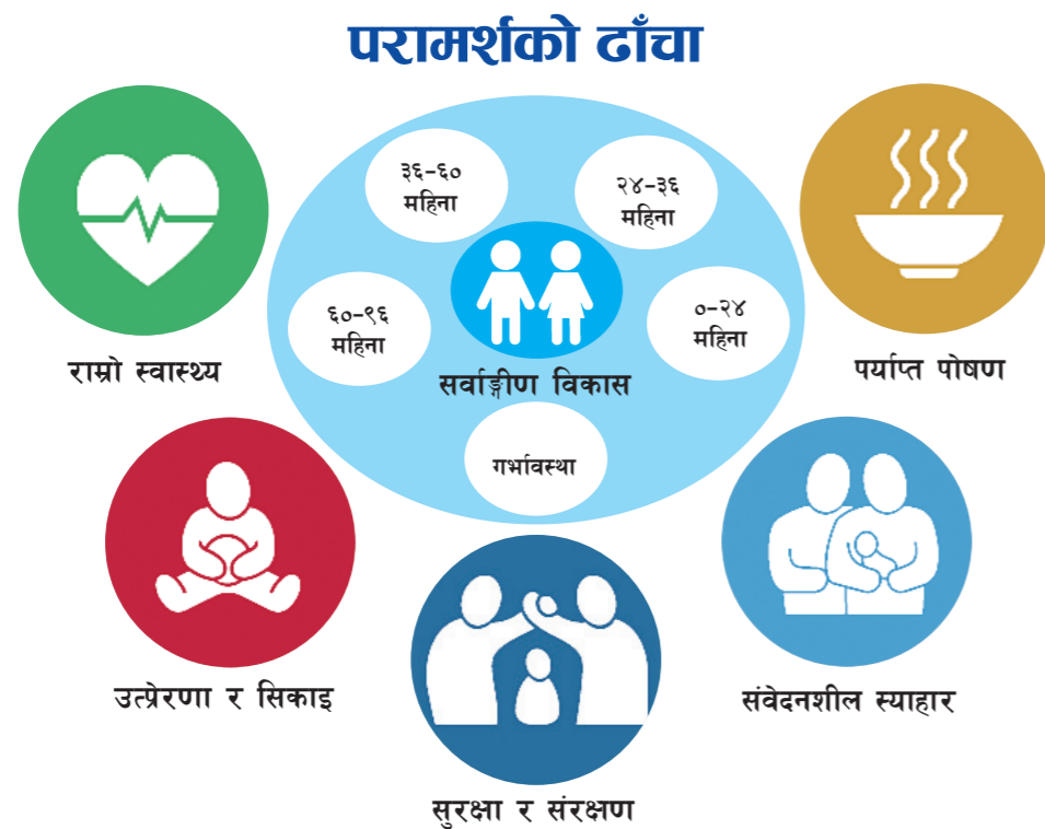
चित्र नं. १